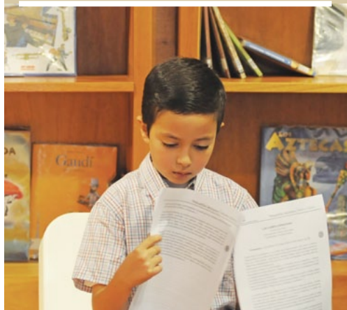
Taller de Pequeños Lectores todos los sábados en la mañana (Escuela de otoño GAM 2013).