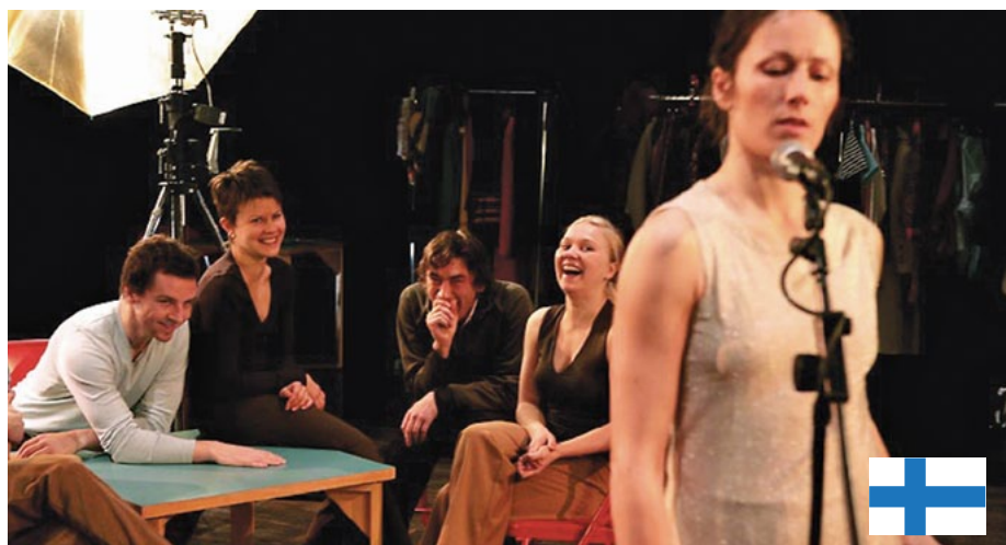
Situation room de Finlandia completa el programa que presenta por primera vez en Chile lo más reciente de la escena escandinava.

Siempre con el afán de estimular a la audiencia, el creador reconoce su interés por descolocar a la gente y así potenciar un distinto nivel de atención e interacción. "Me gusta provocar una suerte de extrañeza y curiosidad en el público (...) 'engañarlo' creando situaciones en las que las palabras dicen una cosa y el cuerpo otra", cierra.