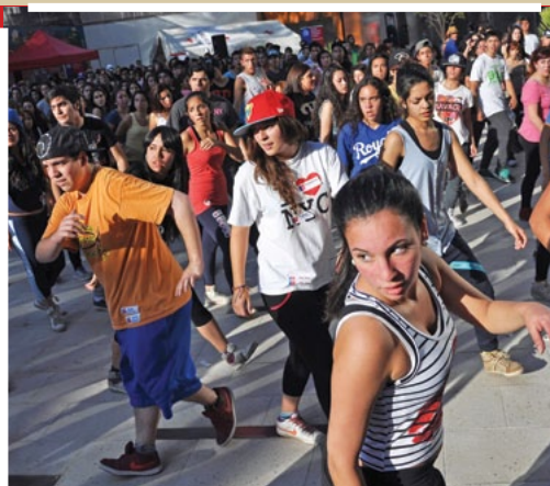
Celebraciones masivas como el Día de la danza.

Centro de las artes, la cultura y las personas.