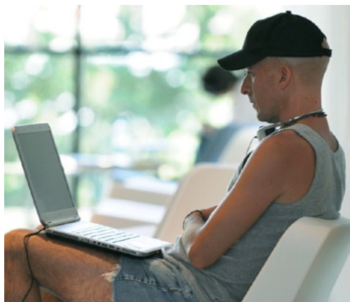
Wi fi gratis en todo el edificio.