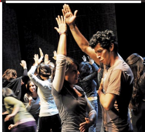
Taller de capacitación para profesores (profesores@gam.cl).