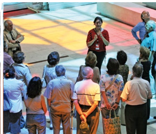
Diferentes opciones de visitas guiadas gratuitas (guías@gam.cl).