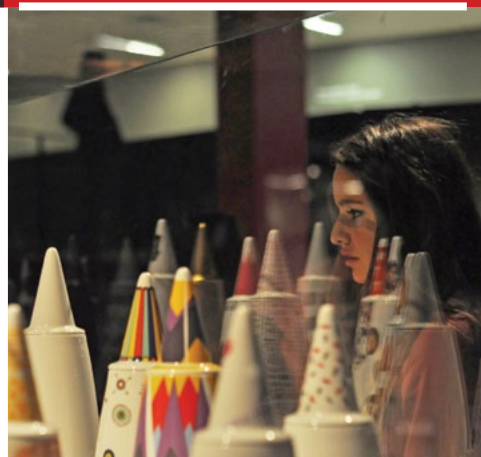
Exposiciones de artes visuales y arte popular ¡gratis!