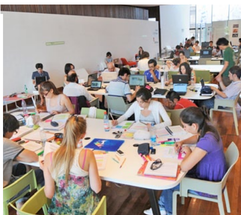
BiblioGAM abierta domingos y festivos.