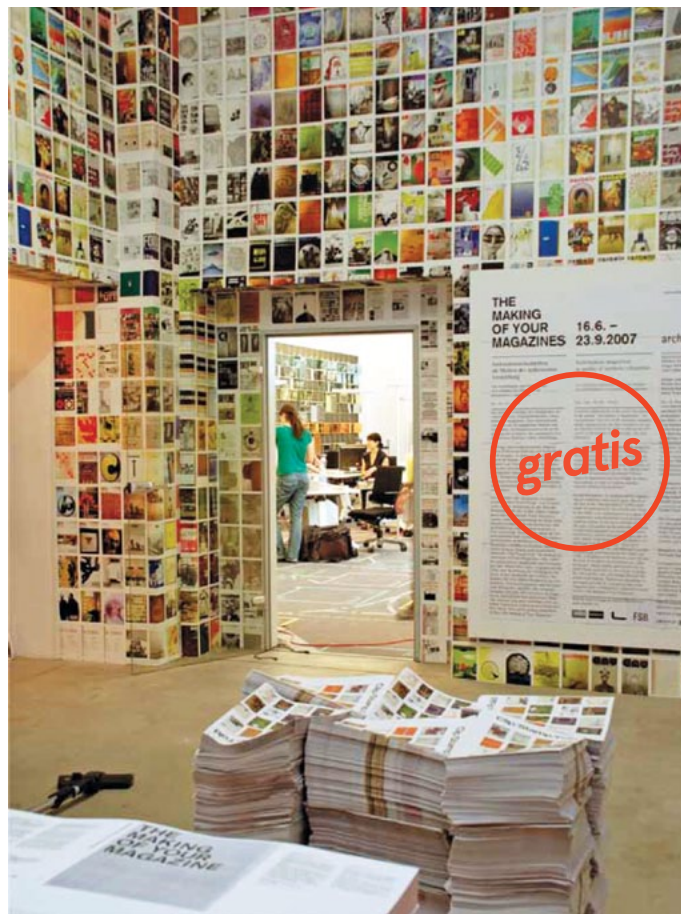
Un mural que compila portadas de distintas revistas, alrededor de 30 bolas de acrílico con verdaderas piezas de culto y una línea de tiempo que sitúa las publicaciones en su contexto forman Clip/Stamp/Fold .