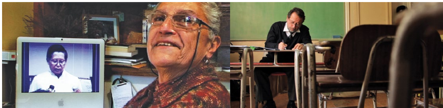
Sibila y Profes son dos de los documentales que estudiantes y adultos podrán ver gratuitamente.

Profes , Sibila y Un hombre aparte son algunos de los documentales que podrán ver gracias a la colaboración que GAM ha establecido con el Festival internacional de documentales de Santiago. La actividad incluye encuentros de conversación con sus realizadores.