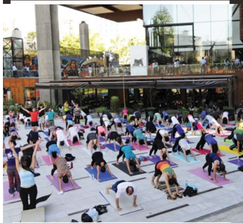
Actividades en plazas y espacios abiertos todos los días de la semana.