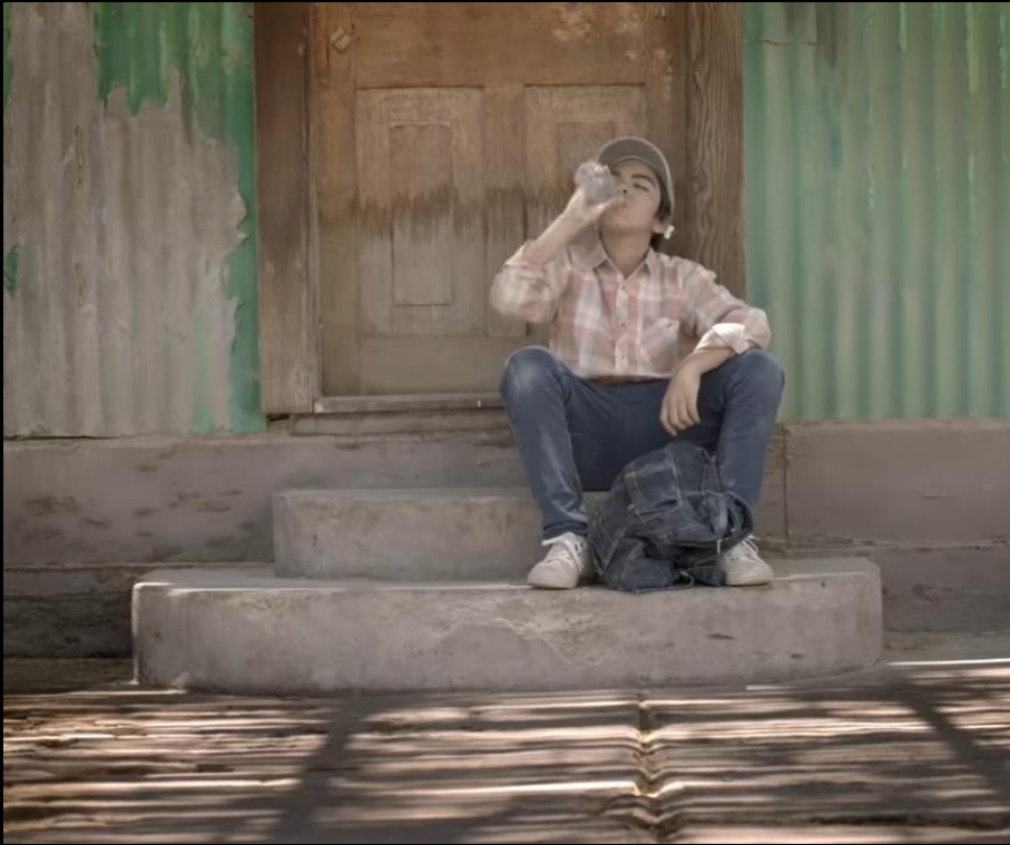
Si te marchas, Santa Fera