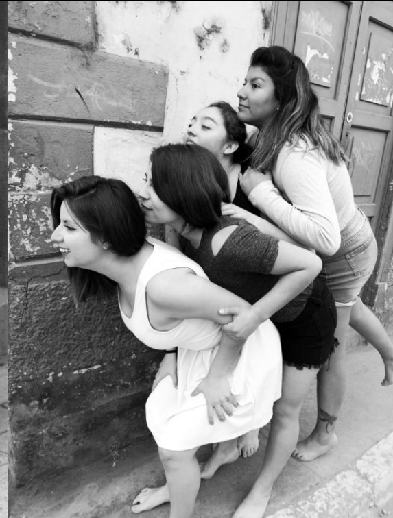
Calle Almagro, La Serena