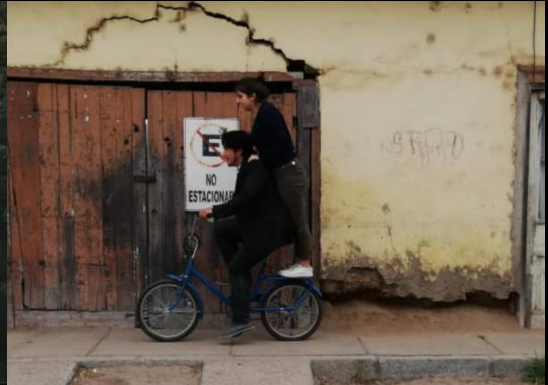
Calle Almagro, La Serena