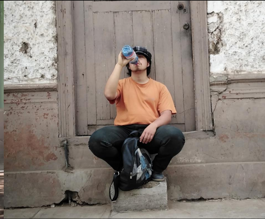
Calle Almagro, La Serena