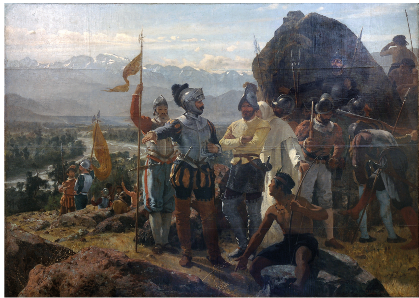
La fundación de Santiago, de Pedro Lira (1888)