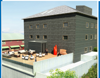
CASA VIOLETA PARRA SAN CARLOS