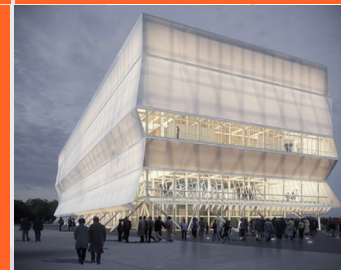
GAM SEGUNDA ETAPA SANTIAGO