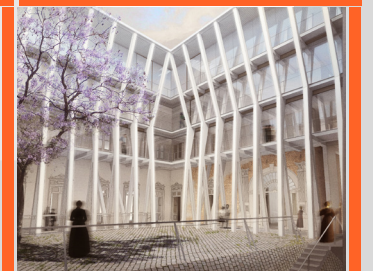
BIBLIOTECA REGIONAL LA ARAUCANÍA