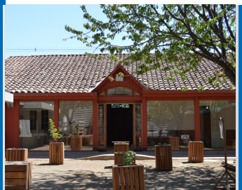
CASA DE LA CULTURA PUNITAQUI