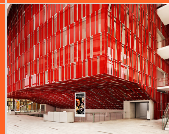
TEATRO METRO MARÍA ELENA