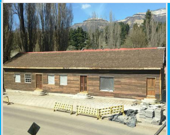
MUSEO DEL RECUERDO UMAG PUNTA ARENAS