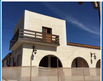
MUSEO REGIONAL DE AYSÉN COYHAIQUE