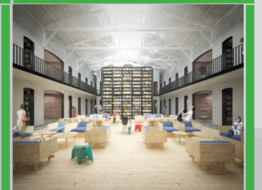
ARCHIVO Y BIBLIOTECA REG. PUNTA ARENAS