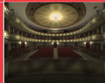
TEATRO CERVANTES VALDIVIA